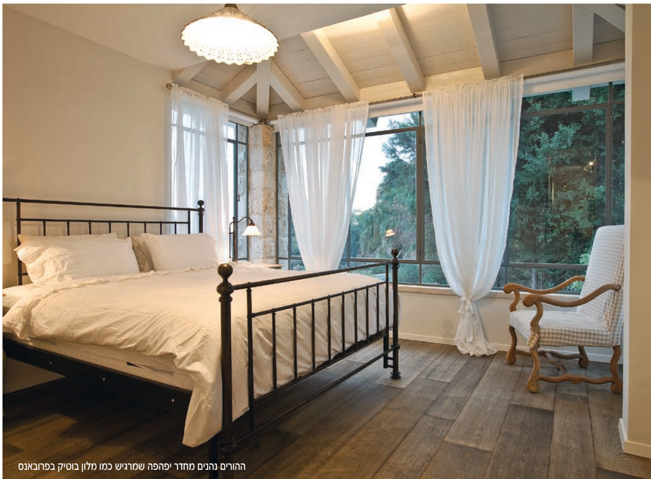
ההורים נהנים מחדר יפהפה שמרגיש כמו מלון בוטיק בפרובאנס

גם שטחי האירוח מזמינים ומשרים אווירת רוגע. כך למשל, שולחן האוכל הגדול הניצב בין שתי פתחים גדולים לנוף, מעליו חלל כפול שחדר ההורים משקיף אליו, ושנדליר ענק שיובא במיוחד מאיטליה. הוא עשוי קריסטלים מעוצבים, מחובר לשרשרת ארוכה במיוחד (ארבעה מטרים), משתלשל מעל ומלטף את השולחן באור רך ונעים. חדר המגורים, אשר עמודי אבן חירבה חובקים אותו, כולל רצפת צ'אפל, ספת בד ושולחן המשולב בסיס ברזל ורצועות עץ מיושן. אלו משדרים אווירת חמימות, נועם ורוגע. המטבח רחב הידיים עשוי כולו עץ מלא צבוע בשמנת במשיכת מכחול ידנית, וידיית הפליז משלימות את הלוק הכפרי. קיר שלם העשוי זכוכית מחולקת בפרופיל ברזל בלגי, כולל המשולש העליון הפוגש את תקרת העץ המשולבת קורות גושניים צבועים בשמנת, משווה תחושת גובה. הוא מכניס פנימה את המראה הפסטורלי של הגן הקדמי, המכותר בעצי פרי, שיחי נוי גבוהים, פורחים רב שנתיים ושיחוני לבנדר סגלגל.