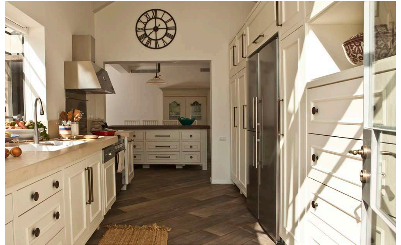
המטבח רחב הידיים עשוי כולו עץ מלא צבוע בשמנת במשיכת מכחול ידנית

הווילה הזו ממוקמת ביישוב מגשימים מזרחית לפתח תקווה, ומשתרעת על פני 230 מ"ר. האזור הוא פנינה כפרית שבה גידולי אבוקדו, אפרסק, שסק, פרסו, אפרסמון, גידולי ירק ותות שדה. הבית עצמו ממוקם בחלקה הגובלת עם שטח חקלאי, שבו שוכנים זה לצד זה מטע של עצי אפרסק וחלקת גידולי שדה, היוצרים יחדיו נוף מרהיב ומשתנה. "היה ברור שיש לנצל את העובדה שבשטח זה לא ייבנו בתים בשל היותו חקלאי וליהנות ממפתחים גדולים אשר יחבוקו ויכניסו את הנוף הביתה". לדבירה, צורכי המשפחה קשורים בשילוב של מרחבי חוויה משפחתיים משותפים, שטחי אירוח וכן פרטיות מלאה לכל אחד מבני הבית. במרחבים המשפחתיים נמצא את פינת האוכל הנפרדת לבני הבית, מעין אי גדול ומפנק אשר מאפשר מקום אחסון מצד אחד ואזור ישיבה מן הצד האחר. וישנו אזור בריכת השחייה וכן פינת הבמבוק, שבה מיטת אפריון מפנקת לרביצה סמוך למדשאה המטופחת אשר מוקפת שיחי לבנדר מרגיעים. ◀