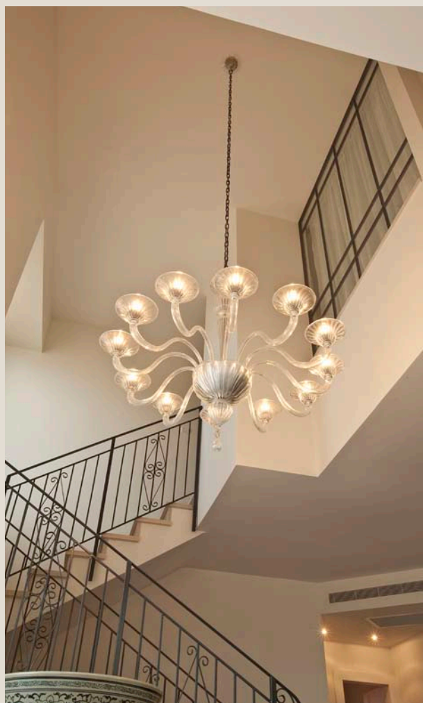
מעל פינת האוכל תלוי שנדליר ענק שיובא במיוחד מאיטליה

עיצוב הפנים של בית זה מספק מענה הכולל רעיונות ותכנון מוקדם שהולם את סגנון החיים של הלקוחות, ומתאים ולטעמם האישי. הוא נוח ופונקציונלי ביומיום ויחד עם זאת – משרה אווירה נעימה והרמונית. ■