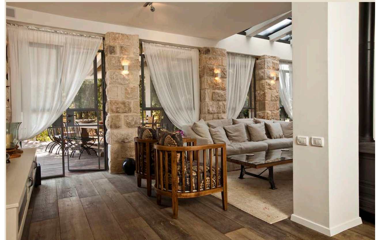
עמודי אבן "חירבה" ניצבים בחלל המגורים

הווילה הזו ממוקמת ביישוב מגשימים מזרחית לפתח תקווה, ומשתרעת על פני 230 מ"ר. האזור הוא פנינה כפרית שבה גידולי אבוקדו, אפרסק, שסק, פרסו, אפרסמון, גידולי ירק ותות שדה. הבית עצמו ממוקם בחלקה הגובלת עם שטח חקלאי, שבו שוכנים זה לצד זה מטע של עצי אפרסק וחלקת גידולי שדה, היוצרים יחדיו נוף מרהיב ומשתנה. "היה ברור שיש לנצל את העובדה שבשטח זה לא ייבנו בתים בשל היותו חקלאי וליהנות ממפתחים גדולים אשר יחבוקו ויכניסו את הנוף הביתה". לדבירה, צורכי המשפחה קשורים בשילוב של מרחבי חוויה משפחתיים משותפים, שטחי אירוח וכן פרטיות מלאה לכל אחד מבני הבית. במרחבים המשפחתיים נמצא את פינת האוכל הנפרדת לבני הבית, מעין אי גדול ומפנק אשר מאפשר מקום אחסון מצד אחד ואזור ישיבה מן הצד האחר. וישנו אזור בריכת השחייה וכן פינת הבמבוק, שבה מיטת אפריון מפנקת לרביצה סמוך למדשאה המטופחת אשר מוקפת שיחי לבנדר מרגיעים. ◀