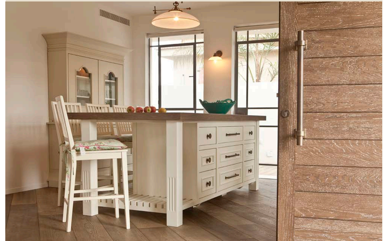
אי מרכזי במראה כפרי פסטורלי במיוחד

"הפרטיות מתבטאת בכך שלכל ילד יש את המרחב שלו, סוויטה אישית הכוללת את כל צרכיו: טלוויזיה, מחשב, משחק מולטימדיה, שלחן כתיבה וחדר רחצה צמוד". ההורים נהנים מחדר יפהפה שמרגיש כמו מלון בוטיק בפרובאנס, בנוי עמודי אבן מפירוקים ונוף עצי האפרסק ניבט מבעד מפתחי הענק. אלו עשויים פרופיל בלגי ועליהם מולבשים וילונות קלילים ומוקפדים. מיטת הפליז ממוקמת במרכז החדר, עם שידות עץ מיושנות שעליהן מנורות לילה מעשה ידי אמן, גם הן מפליז. עוד נמצא כאן אהיל פורצלן ורדרד עדין וכורסה ייחודית וטבעית. כל אלו משדרים אווירה רומנטית וקסומה. ◀